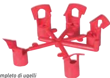
Set completo di ugelli Cinque ugelli intercambiabili – fornito con l'ugello 1,5 preinstallato

Offrono maggiore flessibilità nelle installazioni di nuovi impianti e riducono i requisiti di inventario.