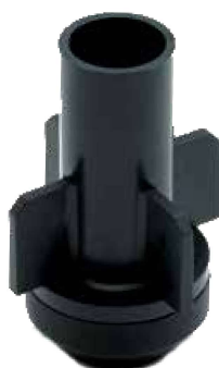
Valvola di ritenuta Opzionale per le installazioni sul campo